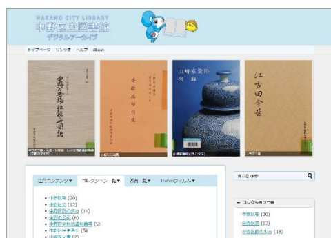
『中野区立図書館デジタルアーカイブの トップページ』

今後、「中野区立図書館デジタルアーカイブ」の閲覧可能なコンテンツの増加や利便性の向上を推進するとともに、当社の他の受託図書館でも IIIF に対応したデジタルアーカイブのシステム構築を目指します。